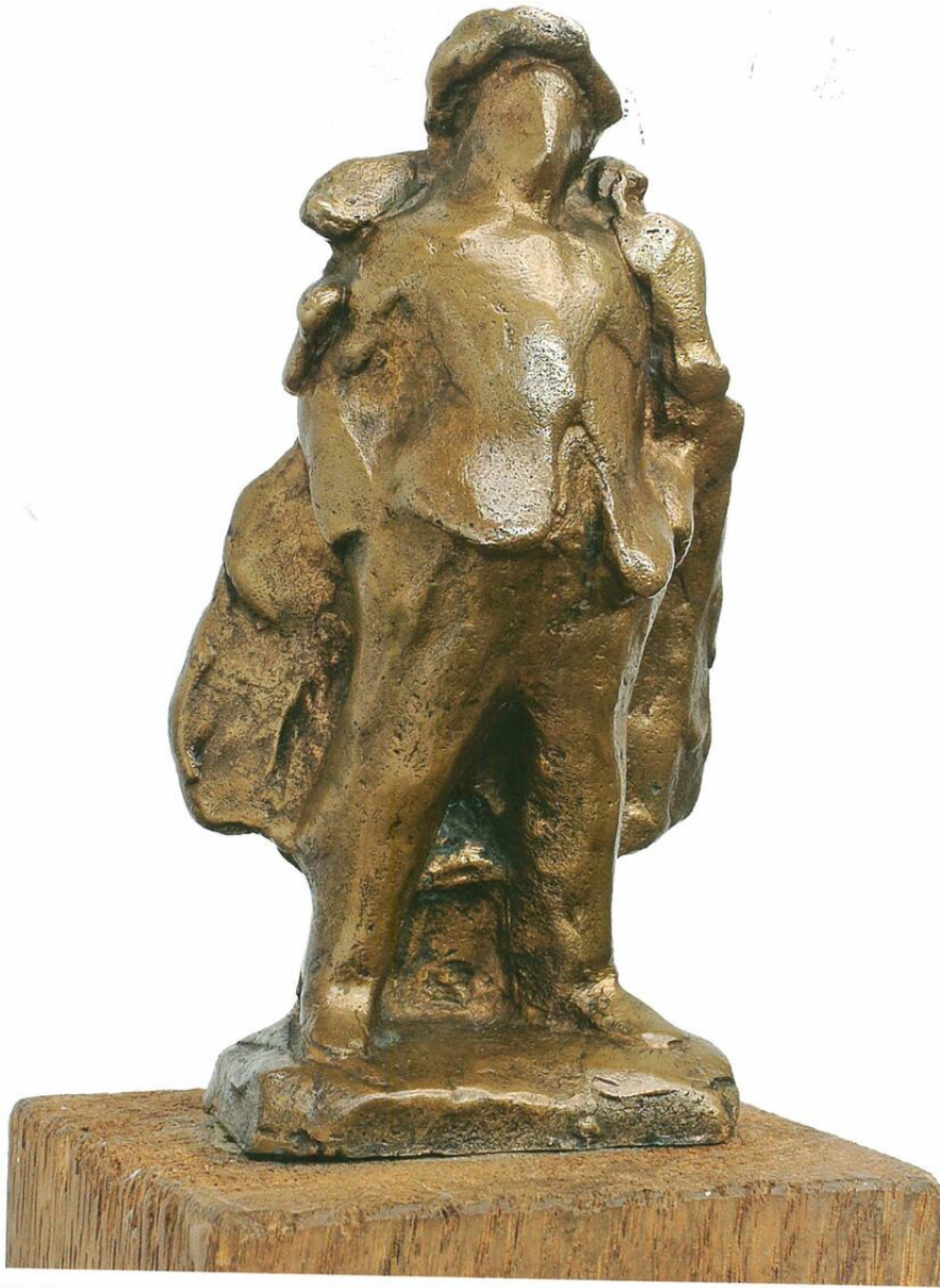
21. Antun Augustinčić: Miroslav Krleža, 1969.