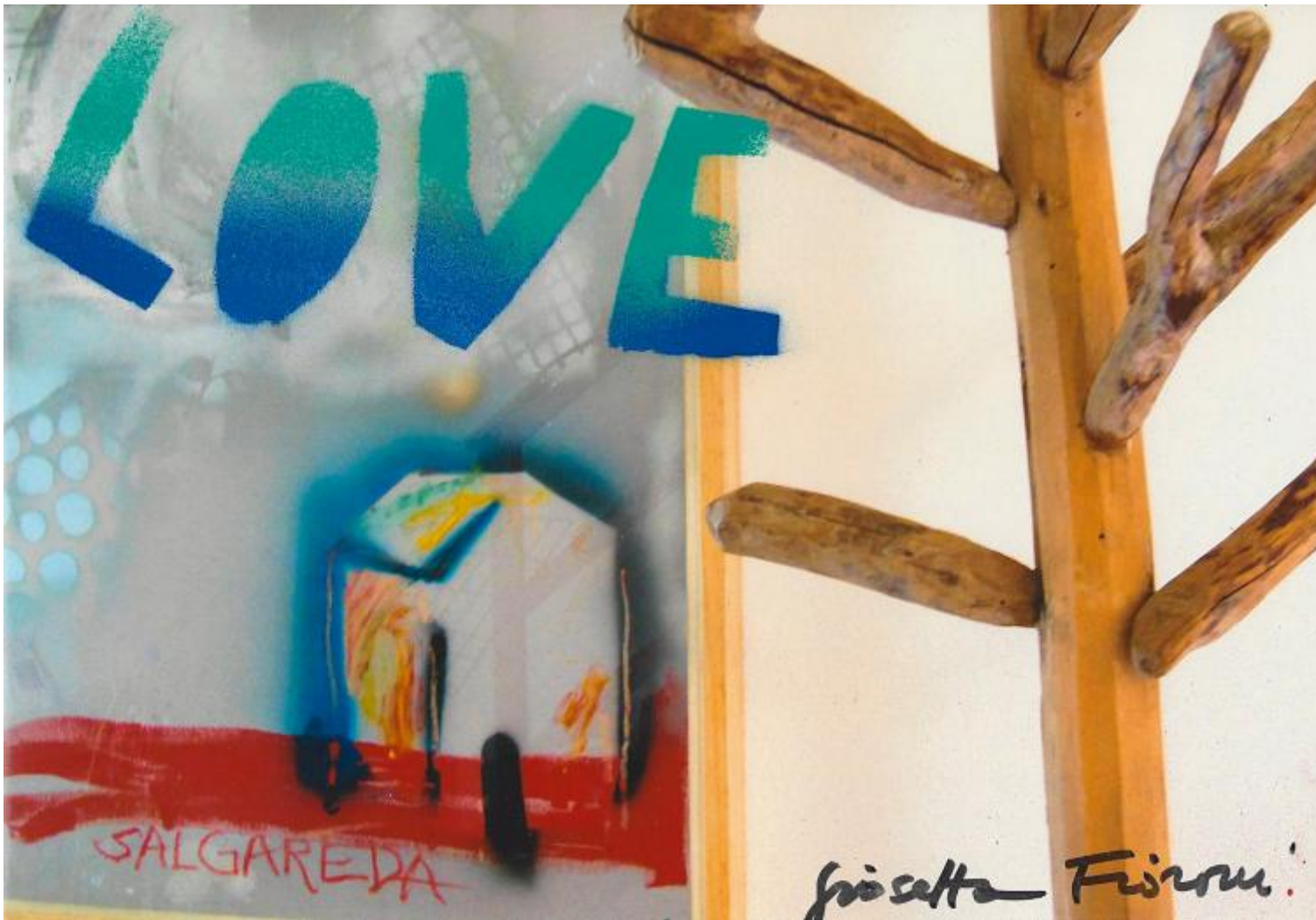
elaborate da Giosetta Fioroni.

Non posso, e me ne scuso, non fare un accenno personale al fatto che anch'io facevo parte di quel paesaggio. Io a Ponte di Piave/Salgareda ci sono nato, e conosco perfettamente quegli odori, quelli di quando Goffredo è giunto sulle rive del Piave e ha deciso di stabilire lì il suo baricentro psichico (era l'epoca del Sillabario n.1 ) con tutto ciò che ne è seguito in termini di relazioni umane e dunque poetici. Ma mentre per me Ponte di Piave era il porto da cui partire, per Goffredo era l'approdo, lui a Ponte si portava dietro dei vissuti strabilianti che erano violentemente messi a confronto con le vite delle persone comuni. Quando lo incontrai, notai fin da subito che Achille-Parise tutti quelli che lo conoscevano volevano raccontarlo, ci provavano, il suo bios in qualche modo li determinava. In fondo "se potessimo intravedere anche solo di spalle Dante Alighieri che s'inerpica sull'Appennino, non capiremmo della Divina Commedia qualcosa di più di quel che oggi ne sappiamo?", diceva Cesare Garboli, il maggiore dei bio-critici, non per caso il maggiore – con Zanzotto – degli esegeti parisiensi.