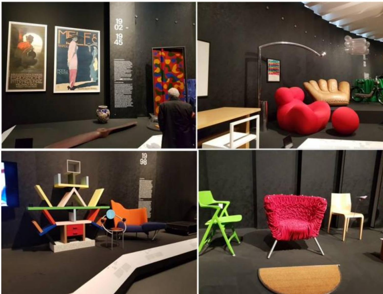
Scorci espositivi di Storie.

che vanno affrontati con logiche differenti rispetto a quelle adottate per il novecento.