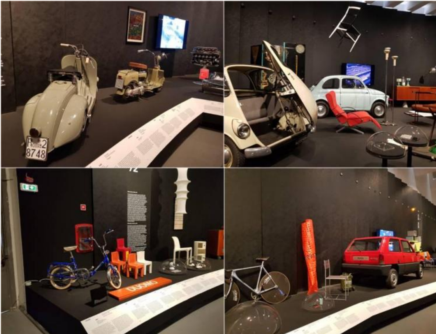
Alcuni scorci del percorso espositivo.

stigmatizza il suo essere divenuta icona del design, in dialogo, lassù, nell'aria, con un'altra poltrona leggera perché d'aria è trionfalmente rigonfia, la Blow (di De Pas, D'Urbino, Lomazzi per Zanotta, 1967), anch'essa una vera star.