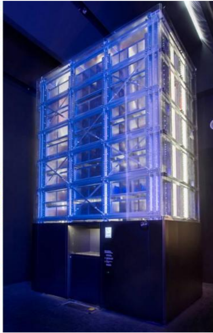
Milano. XI Triennale Design Museum, Storie. Il design italiano.

Quasi fossero emergenze architettoniche, case e non cose, tra auto parcheggiate, dalla 202 Coupé (di Giovanni Savonuzzi e Pinin Farina per Cisitalia, 1947), alla Ferrari 125S (di Gioacchino Colombo per Enzo Ferrari, 1947), dall' Isetta (di Ermenegildo Preti per Iso Rivolta, 1953), alla mitica 500 (di Dante Giacosa per Fiat, 1957), alla Panda (di Giorgetto Giugiaro per Fiat, 1980); biciclette, dalla Graziella (di Rinaldo Donzelli per Teodoro Cinelli, 1964), alla Laser (di Antonio Colombo, Paolo Erzegovesi, Gianni Gabella per Cinelli, 1980); moto e motorini, dalla Vespa (di Corradino d'Ascanio per Piaggio, 1946), alla Lambretta (di Pier Luigi Torre e Giacomo Pallavicino per Innocenti, 1947), dal Ciao (di Bruno Gaddi per Piaggio, 1967), fino al Monster 900 (di Miguel Galluzzi per Ducati, 1993), che chiude il percorso, i pezzi si susseguono con un andamento cronologico; emergono, ma anche si celano, l'uno dietro all'altro, per lasciarsi scoprire, farsi riconoscere, tetragoni e al contempo lievi nella loro conclamata iconicità.