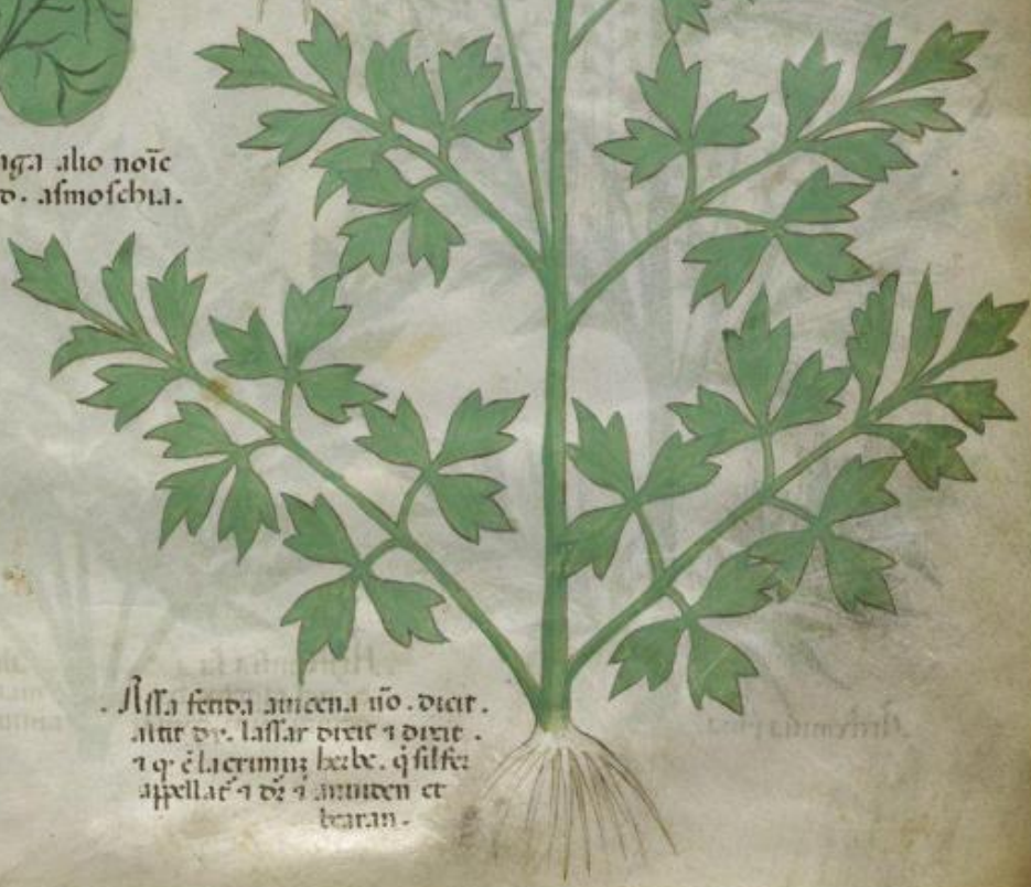
Alla fenda amena no. dicit. alit dy. lassar dicit q dicit. q q e lacrimuz herbe. q silfa appellat q dicit q amuen et bearan.