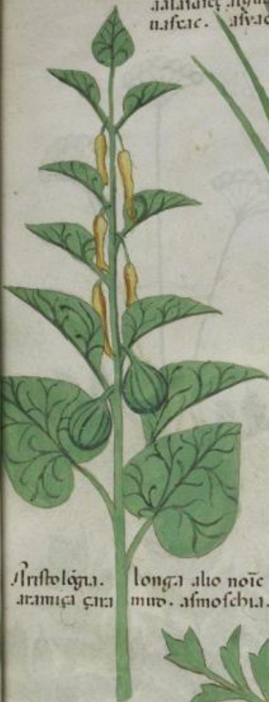
Aristolaga. longa alio noie aramici cari mud. asmoschia.

Artamita herba. e. q. di adariam q aduete. et buchoz. marien.