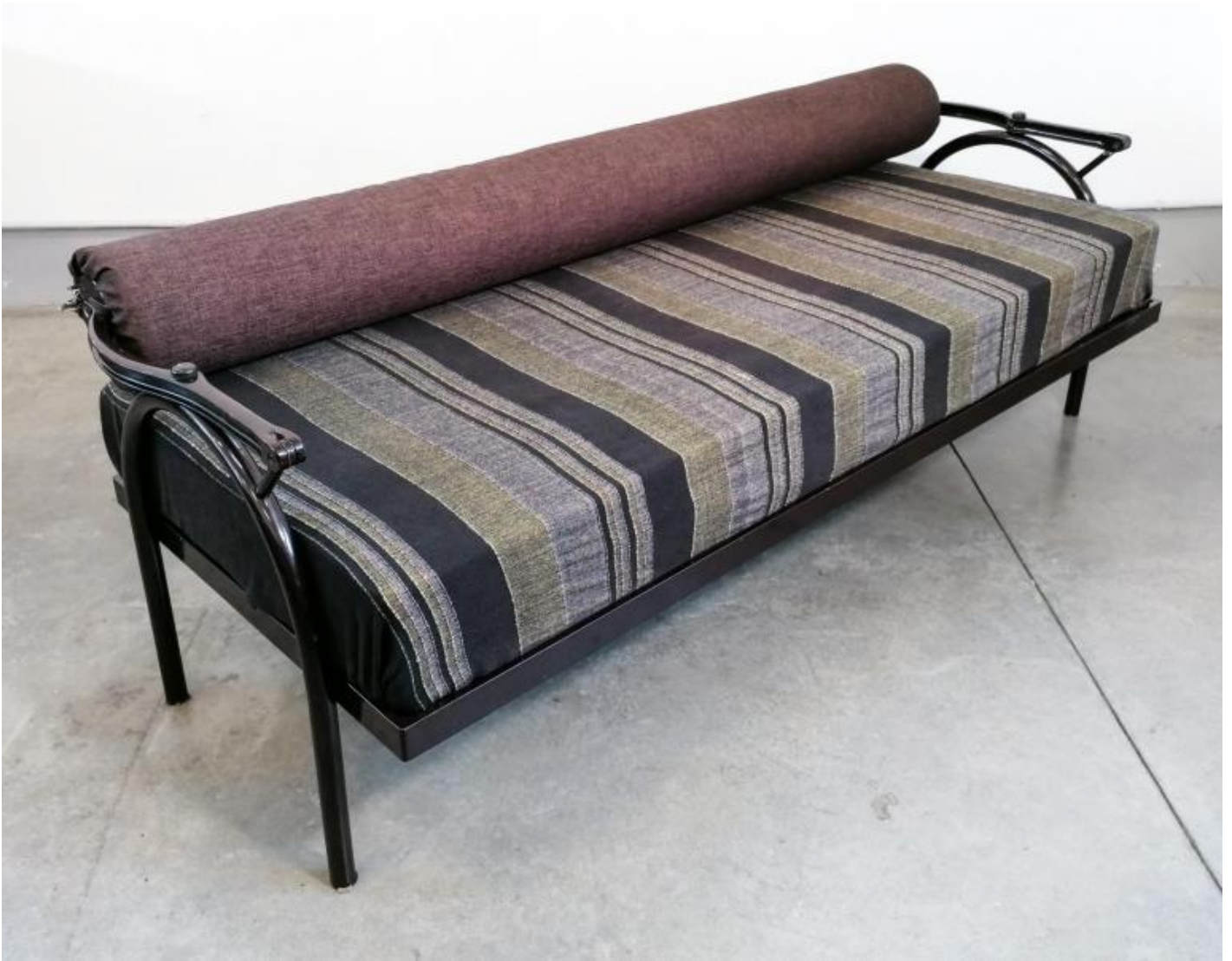
Divano Day-night, Design Enzo Mari per Driade, 1971.