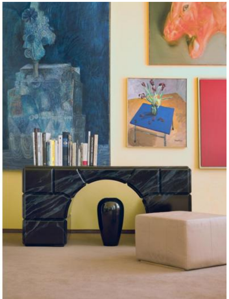
Casa Haussmann.

Questa re-interpretazione di elementi del passato in chiave postmoderna, dove illusione sostituisce imitazione e grandissima importanza viene data ai materiali, ai particolari costruttivi, agli accostamenti, si presta a molte letture. Robert Haussmann nel testo che accompagna la mostra e ne inventa il titolo, afferma l'importanza della tecnica artigianale come parte fondante del lavoro dello studio. È noto infatti che la successiva collaborazione italiana con Alessandro Guerriero e il gruppo Alchimia, pur cementata da una profonda ammirazione reciproca e da una forte amicizia, sia naufragata per la mancanza di precisione nell'esecuzione delle loro opere, aspetto sul quale gli Haussmann fondavano il proprio linguaggio, mai esclusivamente formalista. Il testo si conclude con un appello in favore dell'istituzione di un WWF di quelle tecniche