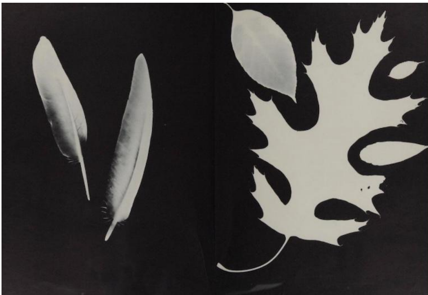
Tana Hoban, Shapes and Things (1970).

L'originalità dell'approccio di Hoban risalta fin dall'opera d'esordio, Shapes and Things (1970), che distilla in bianco e nero una radiografia fantasmatica del quotidiano, tra giocattoli, utensili domestici e cianfrusaglie di ogni genere che emergono dallo sfondo scuro come apparizioni luminose. Lo strano effetto deriva da una scelta precisa: gli oggetti non sono stati fotografati, ma appoggiati direttamente sull'emulsione e quindi esposti alla luce per ottenere l'impressione sulla carta fotografica, secondo la tecnica che Man Ray battezzò rayografia. Fotogrammi come ombre di luce, dunque, creati senza l'utilizzo della macchina fotografica, e in un certo senso originatisi da sé. Mentre l'immagine cessa di essere uno scatto da inseguire e catturare, lo sguardo dell'infanzia si rivela come percezione della prossimità di ogni cosa e visione che nasce e si offre spontaneamente, agli occhi del fotografo come a quelli del lettore.