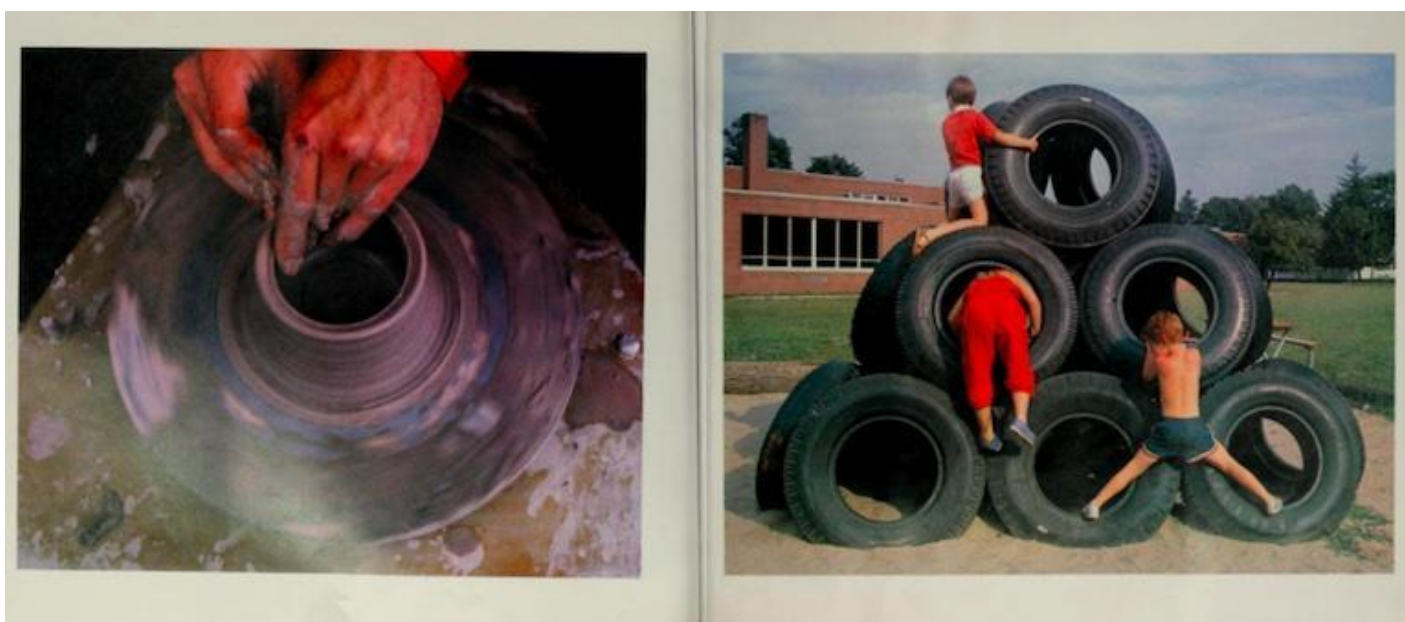
Tana Hoban, Round & Round & Round (1983).