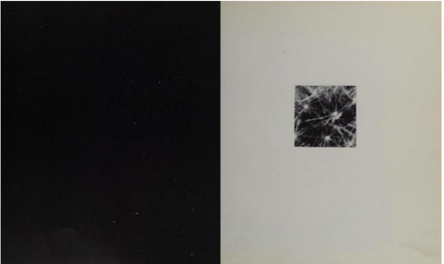
Tana Hoban, Look Again! (1971).

Sarebbe però riduttivo considerare l'origine di questo sguardo solo in rapporto a una questione di tecnica artistica, e la maestria di Hoban, in effetti, sta nell'averlo saputo riproporre e reinventare anche nei libri successivi, mediante il ricorso quasi esclusivo alla fotocamera – salvo rare eccezioni come A, B, See! (1982), che riprende la rayografia – e a particolari modalità di presentazione delle immagini. Look Again! (1971) sembrerebbe a prima vista concepito addirittura in antitesi a Shapes and Things : non più forme ben esposte nate senza il concorso di una macchina, ma una piccola inquadratura ritagliata che di volta in volta indirizza l'attenzione su un dettaglio, prima che il giro di pagina sveli l'immagine completa. Il lettore osserva come dal buco della serratura, eppure ignora ciò che sta guardando: non spia oggetti di cui impadronirsi, ma esplora forme che lo interrogano e lo chiamano a sé. E con la stessa straniante naturalezza dei rayogrammi, le immagini che appaiono a pagina intera dopo essere state oggetto di un'osservazione parziale sono visioni che suscitano meraviglia, proprio perché sottratte a una fruizione immediata. L'espedito tecnico che implica un'analogia tra il bambino il fotografo chiarisce così una caratteristica fondamentale dei libri di Hoban: posta una limitazione, l'esperienza della lettura ne fa il mezzo di ulteriori scoperte che la trascendono.