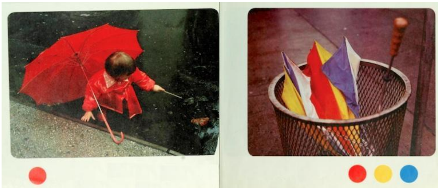
Tana Hoban, Is It Red? Is It Yellow? Is It Blue? (1978).

questa coppia di immagini: il mistero del colore è colto nella sua singolarità e molteplicità, e nella successione di pioggia e bel tempo si accompagna a una precisa intuizione temporale, cui la forma dei due ombrelli associa i concetti di aperto/chiuso. L'indicazione "trova il colore" orienta lo sguardo, ma è solo lo spunto iniziale di una visione che presto è pronta a sconfinare altrove, allo stesso modo in cui sulla copertina di un altro libro, Is It Larger? Is It Smaller? (1985), l'osservazione dei rapporti di grandezza prelude a quella dei colori sugli ombrelli e i vestiti. Come in molte fotografie di Hoban, anche qui la presenza di corrispondenze cromatiche e formali, assieme a una sensibile attenzione per i dettagli, suggerisce la sintonia del bambino con le cose che lo circondano e lo spazio urbano.