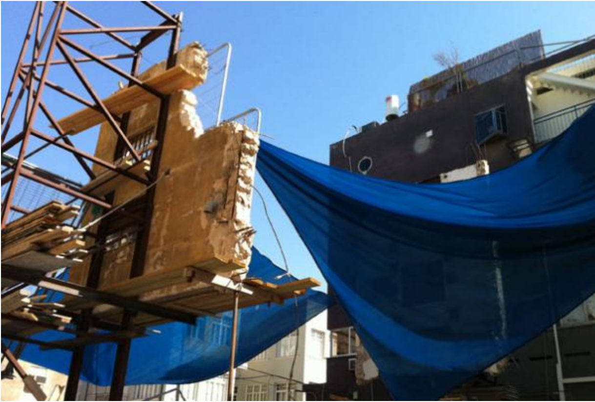
Un cantiere di muri sospesi a Jaffa

Con la testa ancora “calda” dei giorni di Campus in Camps , a sorpresa ricevo l’invito ad anticipare il mio ritorno a Dheisheh ed estendere la mia permanenza fino a gennaio prossimo. Una sorta di saetta che, nel rifugio eremitico eppur frenetico che comprende un cambio di casa e una convivenza, il trasloco dello studio OpenQuadra e l’ingresso nel progetto Archiviazioni, vuol dire riprogrammare i prossimi sei mesi. E non solo.