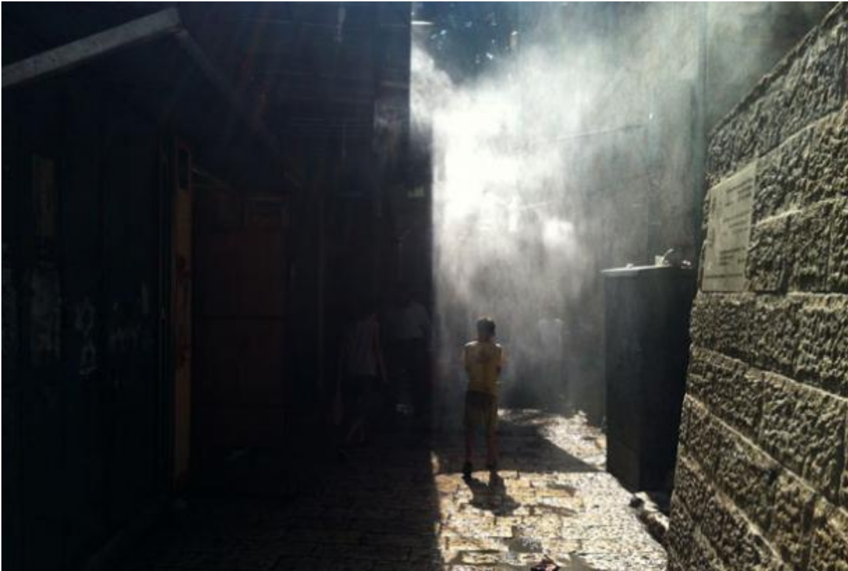
Gerusalemme, vaporizzatori a vicino Lion's Gate, alleviano la stanchezza dovuta al caldo

Betlemme ha fatto costruire cordoli e rotonda all'incrocio che porta ad Al-Feneiq, Ayt. si è ufficialmente fidanzata e pensa già a quando verrà al Campus con un bimbo in braccio (previo matrimonio, ovviamente!), in West Bank i prezzi (controllati da Israele) sono aumentati dal 25% al 50%. Me ne sono accorto. Un ulteriore segno che l'attacco all'Iran potrebbe essere imminente. In tempo di crisi economica anche per lo Stato guerriero, o risucchia risorse dai cittadini e dalla colonia o sta preparando un'economia di guerra risucchiando risorse dai cittadini e dalla colonia. O entrambe le cose.