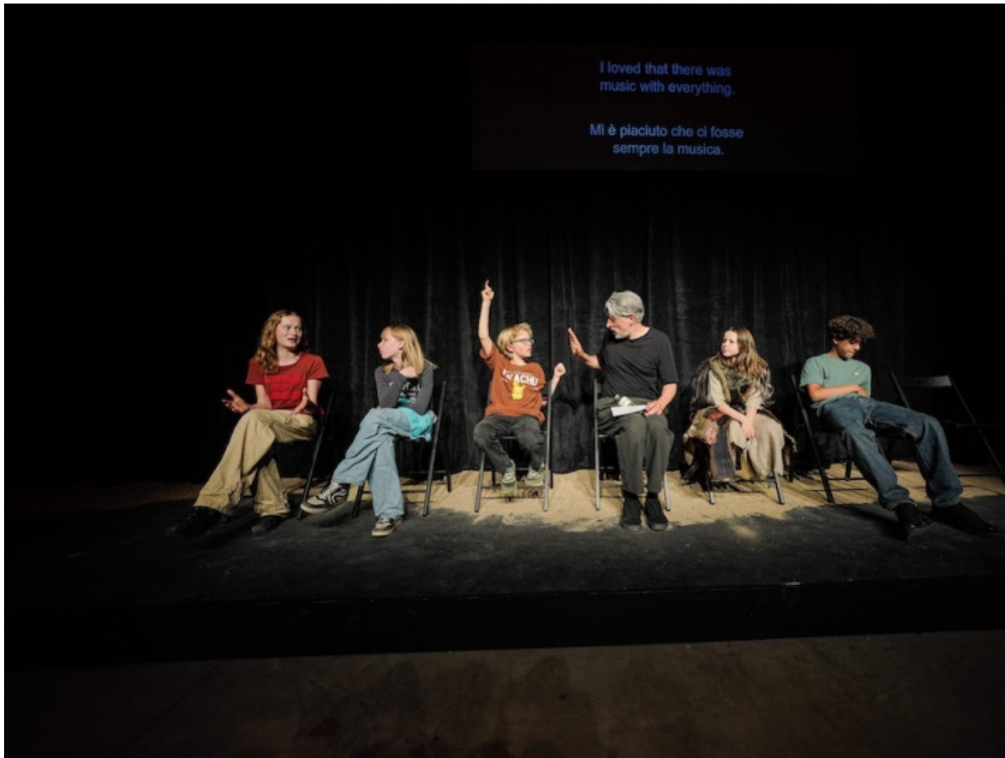
Milo Rau, I figli di Medea.