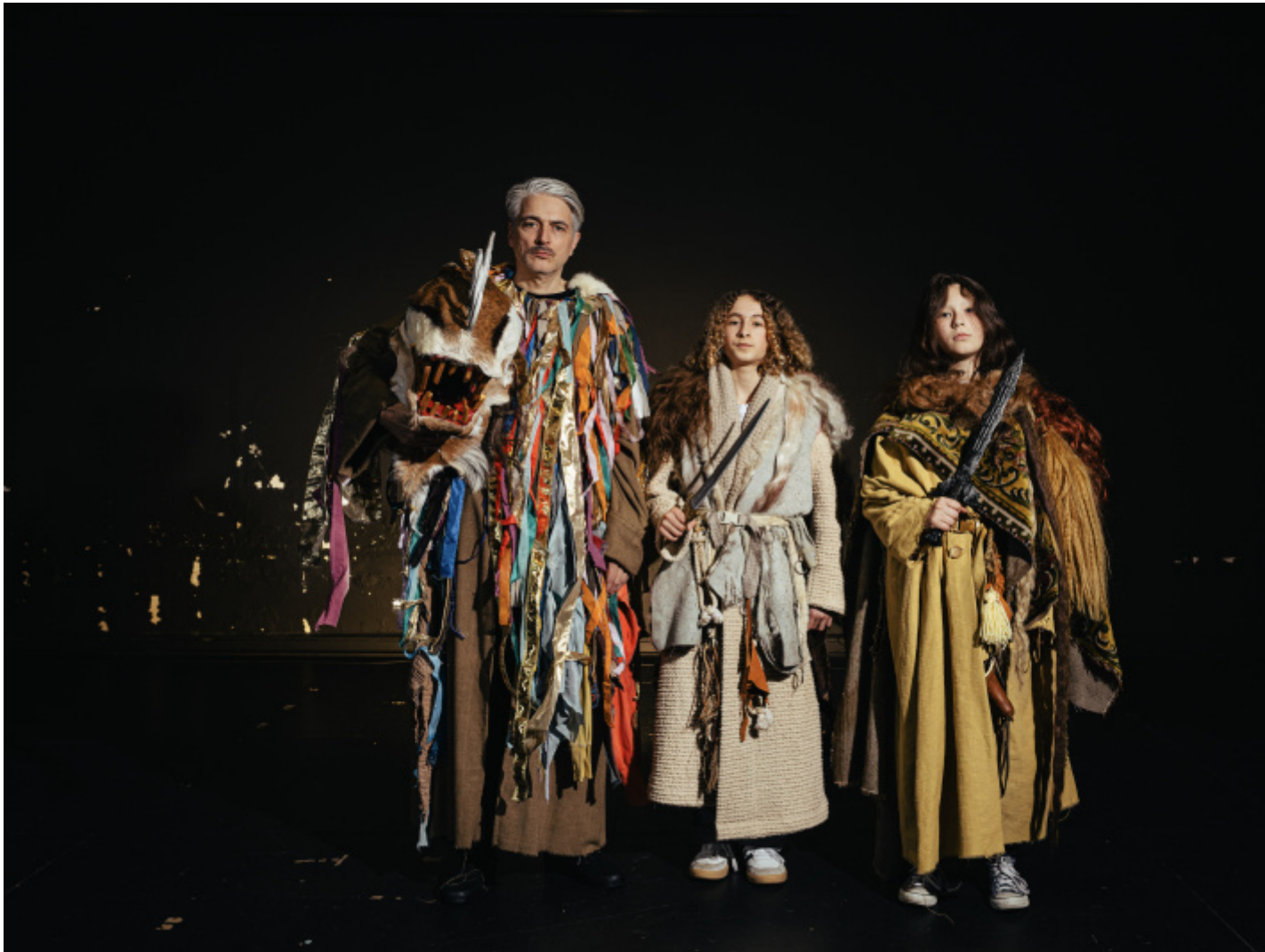
Milo Rau, I figli di Medea

incoraggiandola, “nonostante la notte di sangue”. Un bambino biondo interrompe l’intervista, afferma che ogni generazione ha la sua concezione del tragico, prodigandosi in un bignami di storia del teatro, da Eschilo che crede nel fato ai personaggi di Euripide, disegnati nelle loro psicologie quasi con coscienza moderna. Ora il bambino che interpreta Giasone chiede insistentemente di rifare il suo monologo, forse questo piano intellettual-borghese lo affatica. Vuole rifare e giocare , è quasi un personaggio in cerca di autore ma è anche un attore in cerca di uditorio, e di visibilità. È qui che quel sipario alle loro spalle si apre.