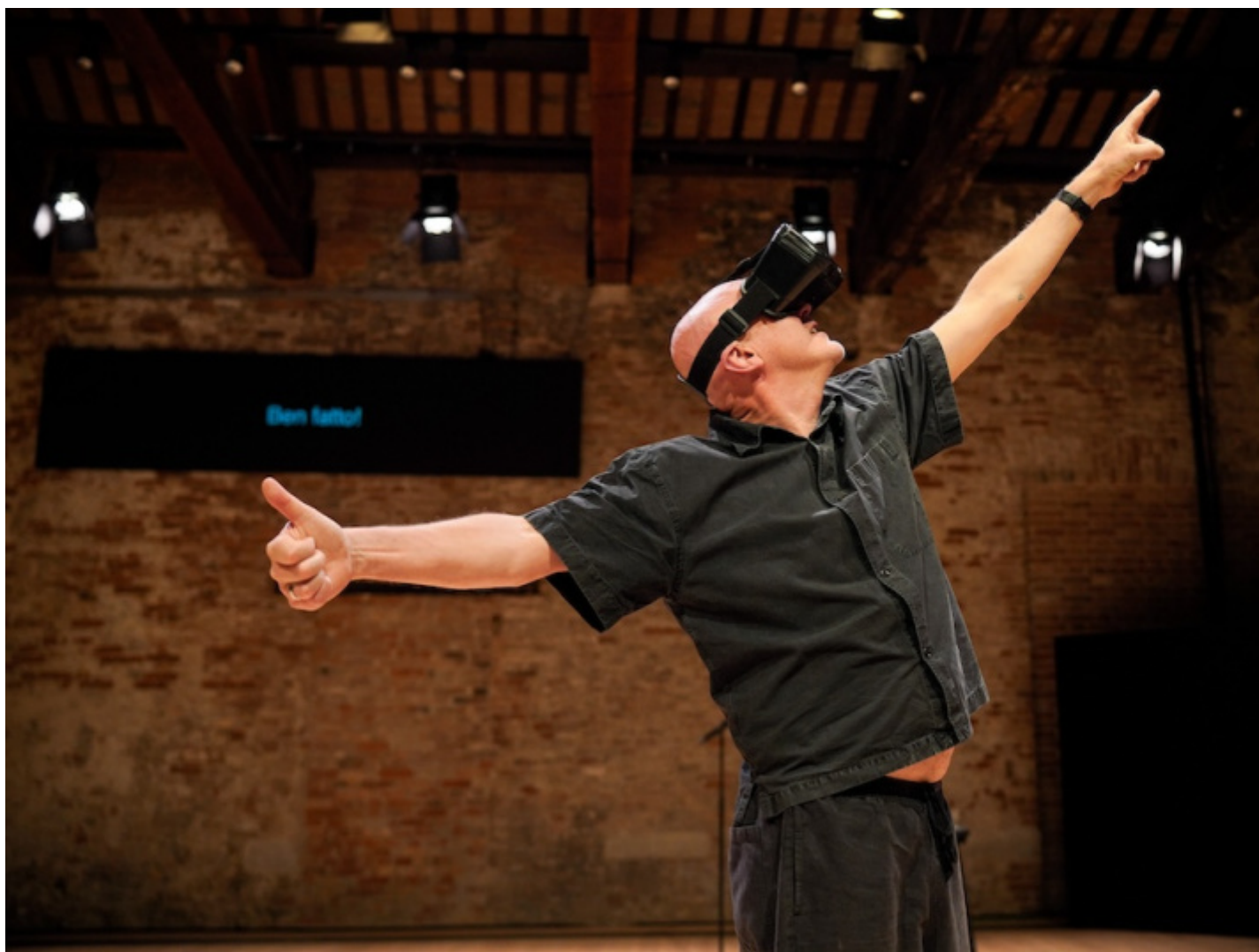
Tim Crouch, Truth's a Dog Must to Kennel .

Per esempio, quella delle presenze internazionali, che spesso si interrogano sull'atto stesso del recitare, del fare teatro, come in questa edizione Tim Crouch, drammaturgo e attore, in Truth's a Dog Must to Kennel . Lo vediamo alle prese con una vera/finta recita con un visore di realtà aumentata nel quale forse non scorre nessun mondo altro, con apertura alla stand-up comedy e alla barzelletta, con evocazione degli scenari dell'apocalissi umana del terzo atto del Re Lear di Shakespeare, in una landa desolata, in una brughiera senza umanità, nella tempesta. È il mondo nostro di domani o già di oggi, o è un gioco troppo facile, ripetuto cento volte, da Pirandello, da Brecht e da Godard in avanti fino a noi? È la continua, un po' spuntata, questione della continua interrogazione metateatrale su quello che stiamo facendo quando facciamo qualcosa, di cosa stiamo fingendo o di cosa stiamo rischiando di vero quando fingiamo, quando giochiamo al teatro, arte virtuale per eccellenza.