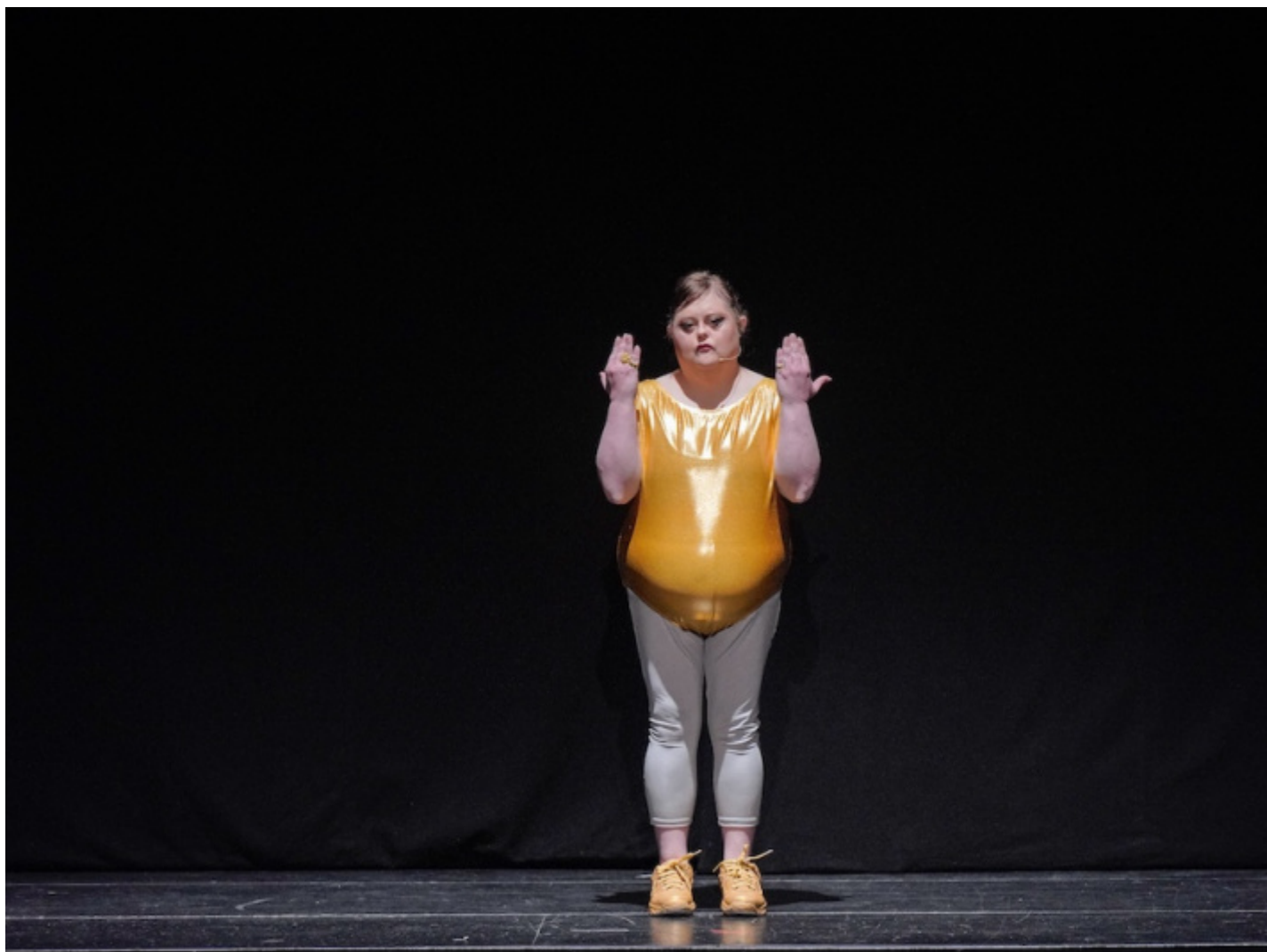
Back to Back Theatre, Food Court .

Come sempre è un vorticare polimorfo di immagini, di pratiche, di visioni, la Biennale Teatro, l'ultima edizione con la direzione di Stefano Ricci e Gianni Forte. Proviamo a tracciare un bilancio, a ricordare alcuni spettacoli, a porci varie questioni, a chiederci come il nuovo Presidente dell'Ente, Pietrangelo Buttafuoco, si muoverà per nominare il prossimo direttore artistico. E raccontiamo lo spettacolo di Milo Rau, che come sempre pone temi urgenti e scottanti alla riflessione sull'atto, sull'estetica e sull'etica teatrale.