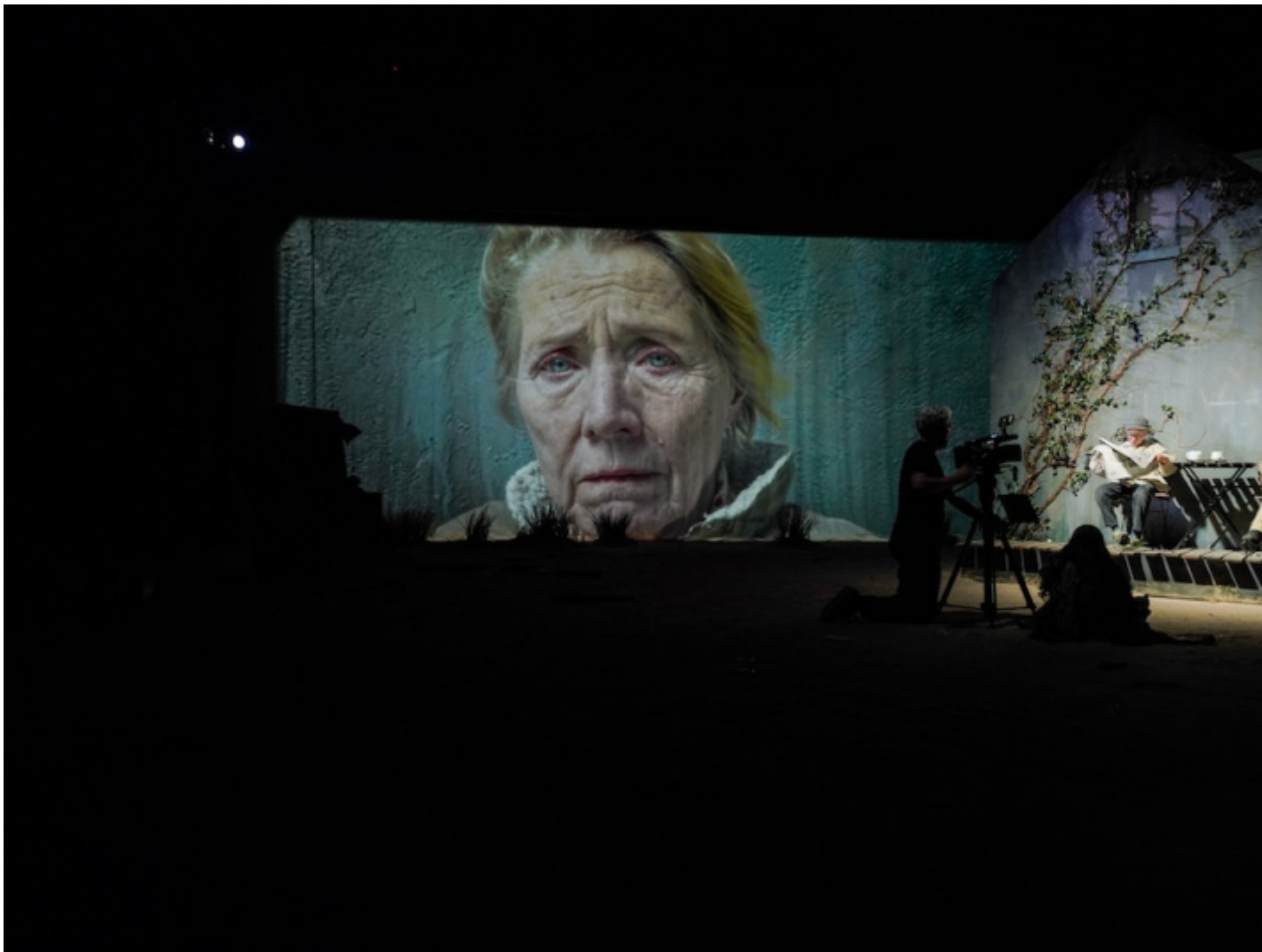
Milo Rau, I figli di Medea.

dal piano della tragedia al piano della cronaca , cioè alla storia della madre di Amandine, interpretata in video da un'attrice anziana ma 'rifatta' nel tempo reale da una delle bambine; alla storia del Doctor Glass, anziano signore che ha adottato il marito di Amandine, e quella di suo figlio, padre che ha perso i figli (Giasone nel piano della tragedia), di cui ascoltiamo la testimonianza sempre negli intervalli di una regia live che mescola immagini riprodotte e il tempo reale di un'azione riprodotta qui ed ora , con gli attori bambini ripresi all'interno di un'abitazione che occupa fisicamente un lato del palco. Per ascoltare la storia di Amandine scendiamo al piano terra di quella stessa abitazione: in video seguiamo la bambina-attrice camminare in un supermercato per acquistare un coltello, in scena i bambini-figli-attori stanno seduti davanti alla tv al centro del palco. In scena si alza la bambina-attrice-Amandine-Medea e li conduce, uno alla volta, dentro la casa al piano inferiore. Li segue l'attore adulto, che indulge in primissimi piani e zoom di gole tagliate e coltellate al ventre. In sala il silenzio è assoluto, qualcuno esce non sopportando la vista. Dopo la prima esecuzione, il rituale si ripeterà per altre quattro volte, con le grida ovattate che sembrano provenire solo dal video in live, mentre dalla stanza di fronte a noi, fonte delle immagini, sembra non uscire un solo suono.