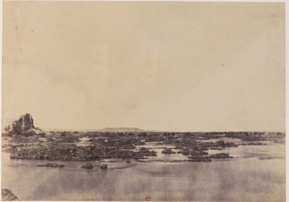
Il Nilo di fronte ai Monti Tebani, 1853-54.