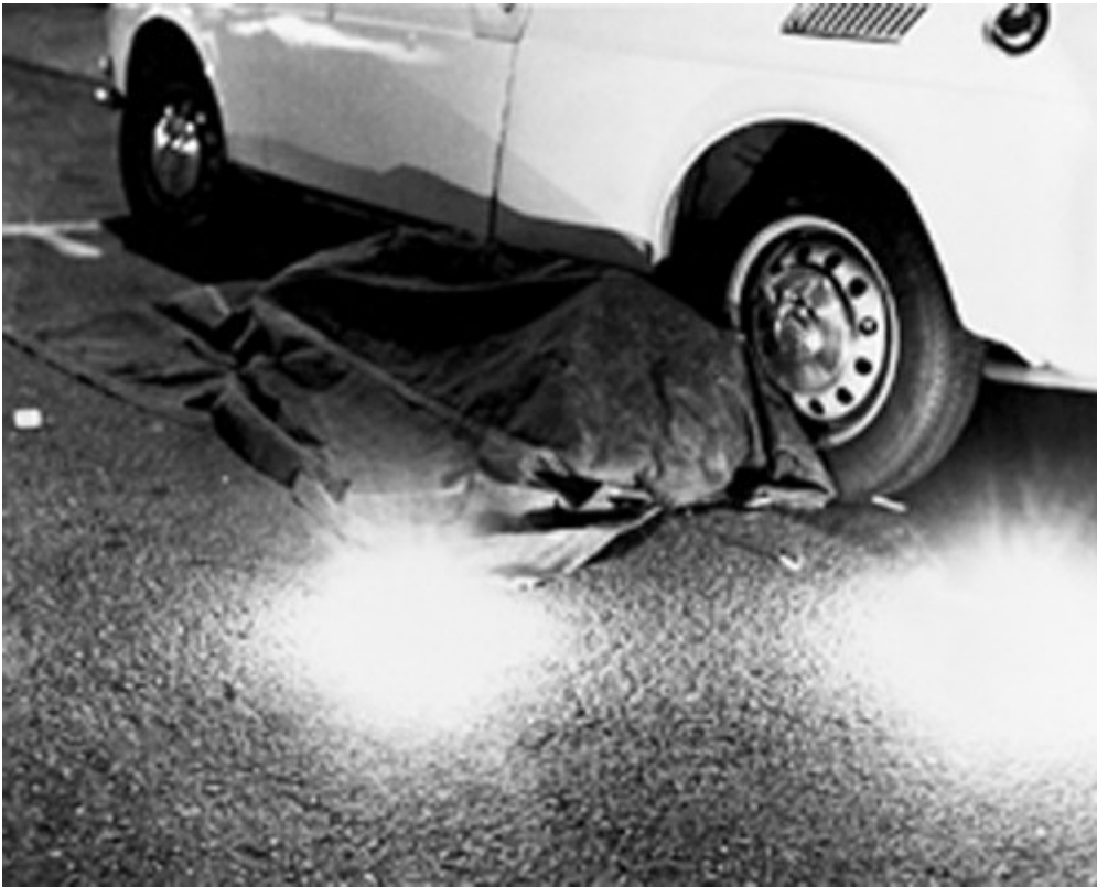
Chris Burden, Dead Man , 1972

Ora, a ben vedere, persino Shoot è meno plateale di quanto sembra sulle prime: l'unico documento che ci resta, il filmino amatoriale in super8 girato con disinvoltura dall'allora compagna dell'artista, è a bassissima definizione, in gran parte senza immagini, con poche voci sullo sfondo (“...know where you're gonna do this Bruce?”). Pochissime anche le foto in bianco e nero. Fedele alla forza negativa della sottrazione, le sue azioni più estreme, di cui pochi sono stati testimoni, furono orchestrate così. Più numerose di quanto possa riassumere qui, Kristine Stiles ne ha contate quindici tra il 1971 e il 1982.