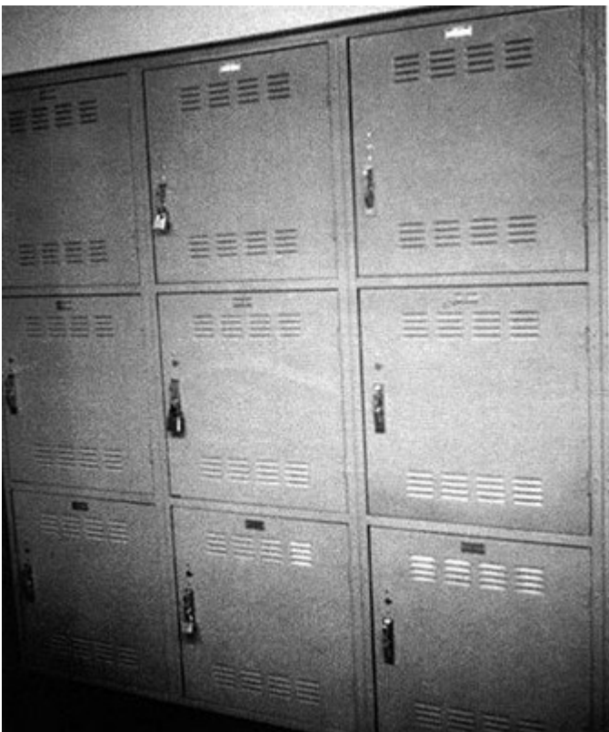
Chris Burden, Five Day Locker Piece, 1971

Oh, Dracula non è isolata nell'operato di Burden ma ne sviluppa con grande maturità e coerenza alcune intuizioni. Nel 1971, per ottenere il diploma di master a Irvine, restò cinque giorni (26-30 aprile) chiuso dentro un armadietto di 60x60x90 cm ( Five Day Locker Piece ). Nel 1975 restò disteso all'interno di una piattaforma triangolare ed elevata alla Ronald Feldman Gallery di New York ( White Light/White Heat ) per 22 giorni (8 febbraio-1 marzo) – immobile, isolato, invisibile, muto e a digiuno tranne un bicchiere di succo di sedano al giorno. Lo spettatore inavvertito che entrava nella galleria poteva pensare a una mostra minimalista alla Robert Morris. Ma la struttura sospesa a 60 cm dal soffitto somigliava meno a una scultura che a un cassetto. Era uno spazio abitato da una presenza nascosta, da un fantasma.