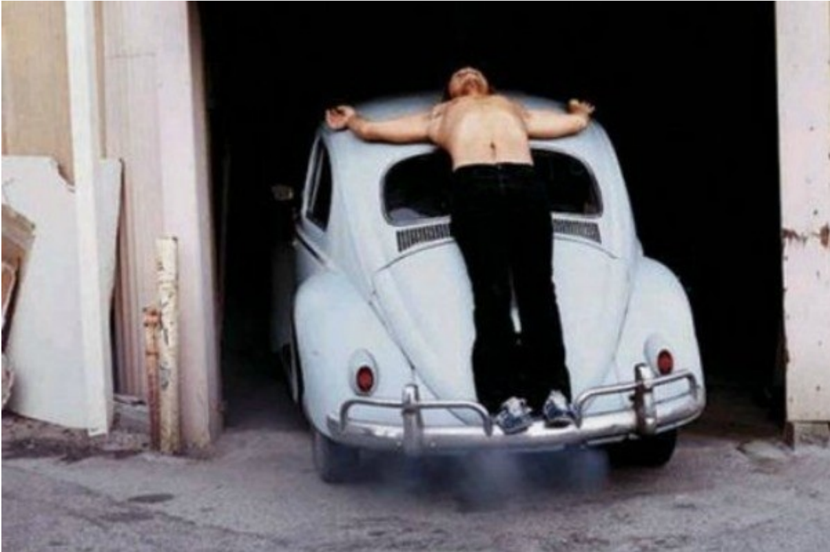
Chris Burden, Trans-fixed , 1974

Trans-fixed . Il 23 aprile 1974 Burden si fa crocifiggere i palmi delle mani sul tetto di una Volkswagen che esce lentamente in retromarcia da un garage per mostrarsi al pubblico. Il rombo del motore sta per il dolore dell'artista. Dopo due minuti la macchina rientra nel garage e la saracinesca si abbassa. I riferimenti religiosi non sono solo nell'inequivoca postura, ma anche nel modo di offrirsi allo sguardo pubblico, come un'annunciazione o un presagio di morte. Se Burden testa e spinge all'estremo i suoi limiti fisiologici – la body art è per lui “an examination of reality, a calling into question of what it is to exist” [da un'intervista con Roger Erbert, 8 aprile 1975] – il vero bersaglio è il pubblico, messo in pericolo nel semplice esercizio dello sguardo. Come ha ben colto Peter Schjeldahl [in “ The New Yorker ”, 15 maggio 2007], chi assiste alle azioni di Burden resta indeciso tra l'educazione civica che lo induce a intervenire in una situazione d'emergenza e il taboo istituzionale di non toccare le opere d'arte.