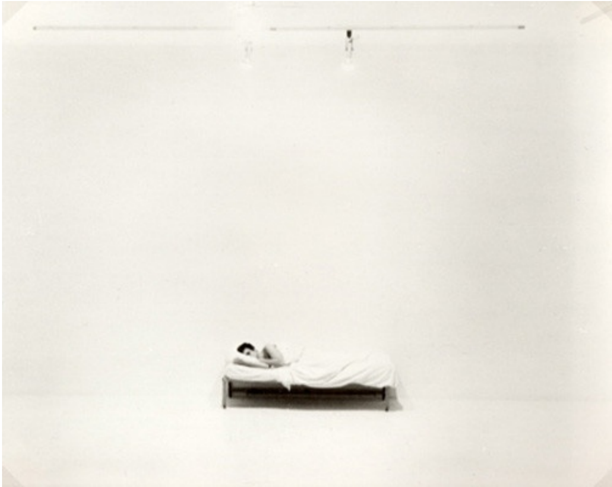
Chris Burden, Bed Piece , 1972

sinistro senza anestesia, durante i nove mesi di convalescenza si avvicinò alla fotografia. E nel 1972 piazzò un letto singolo con le lenzuola bianche in una galleria, restandovi ventidue giorni senza aprire bocca ( Bed Piece ).