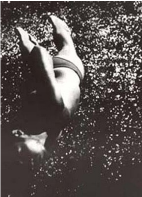
Chris Burden, Through The Night Softly , 1973

Solo più tardi mi sono convinto che il cuore delle azioni di Burden è lontano dalle prime impressioni suscitate da Shoot e Trans-fixed , e che è da cercare piuttosto nella scomparsa, nell'invisibilità e nell'assenza. In Burden la body art è indissociabile dall'aspetto concettuale, come lo è l'azione dal protocollo. Shoot ha bisogno del white cube della galleria: è qui e non in un poligono che si è sparato contro un artista.