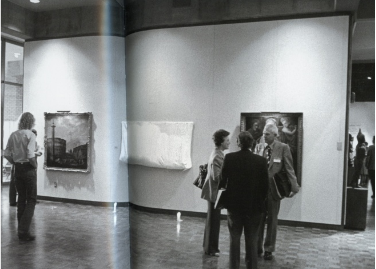
Chris Burden, Oh Dracula, 1974