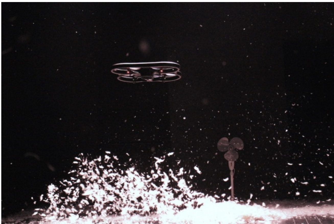
CollettivO CineticO, Miniballetti, ph. Stefano Partisani

I Miniballetti , e qui entra un altro elemento della scomposizione-ricomposizione su un altro piano del cubismo CineticO, erano brevi coreografie annotate su un quadernetto dalla Pennini bambina e pre-adolescente, a testimoniare una vocazione precoce coltivata poi con puntigliosa, disciplinata, bruciante passione. Ora la danzatrice realizza quei sogni di bambina: e sembra che abbia studiato, tutti questi anni, danza, ginnastica, solo per materializzare fantasie, desideri infantili.